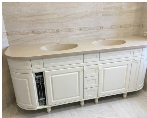
Фото 1 (изделие №1)