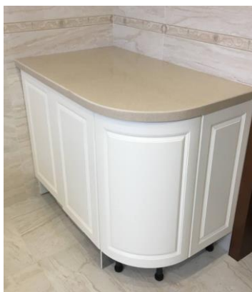
Фото 2 (изделие №2)