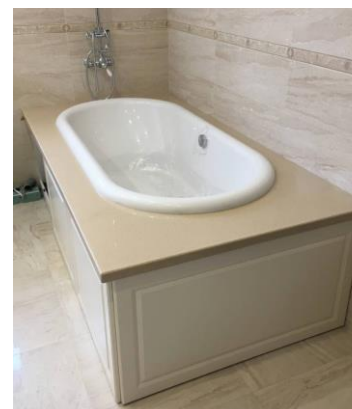
Фото 3 (изделие №3)

Исследованию подлежали изделия из литьевого камня в количестве трёх единиц (фото 1-3). Изделия были изготовлены и доставлены на вышеуказанный адрес ИП *****ым М.Н. согласно договору подряда № ФК 28-04\21 от 24.11.2020 года